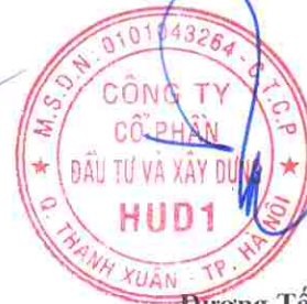
Đương Tất Khiêm